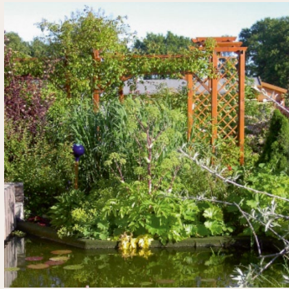
Privatgarten Lorenz Hagen

im Cuxland, Bremerhaven und der Wesermarsch. Adressen und Öffnungszeiten erscheinen im Frühjahr in einem Prospekt.