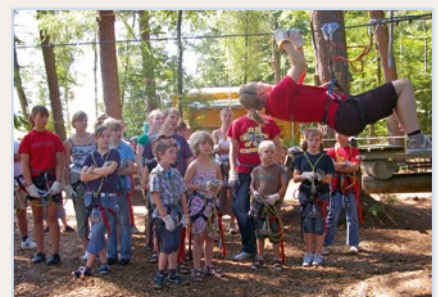
Klettern im Ferien-Express