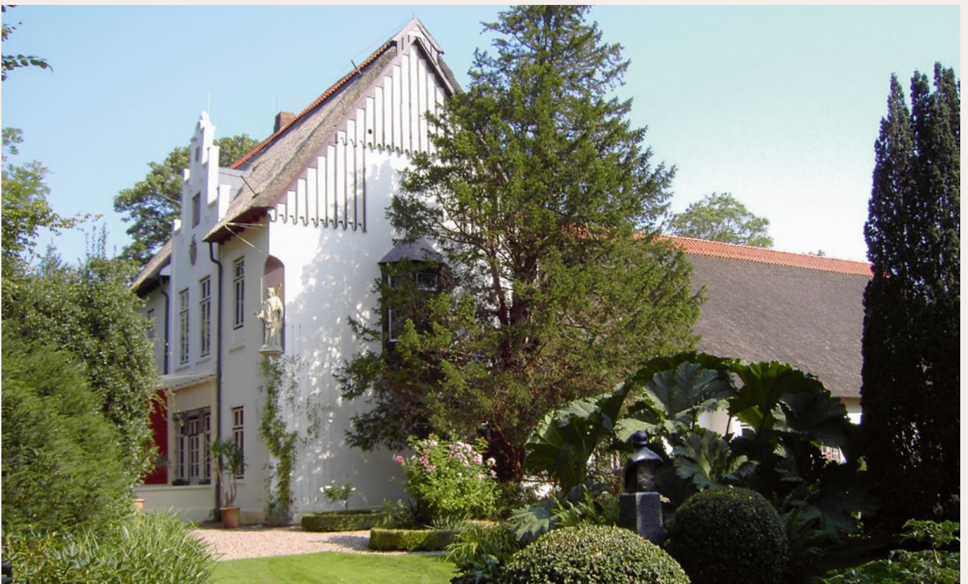
Eindrucksvolles Kleinod: Das »Hermann-Allmers-Haus« ist heute zur Besichtigung freigegeben

Adresse: Mittelstraße 1, 27628 Rechtenfleth, www.hermann-allmers.de Heiraten: Trauungen im Antikensaal möglich – Telefon (0 47 46) 87 50