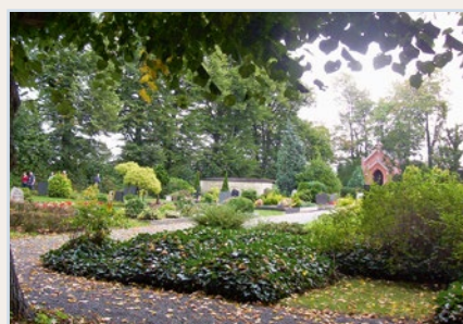
Tag des offenen Denkmals

Januar Hagener Eiswette März Musiktage in der Burg zu Hagen April/August Zuchtschau und Windhundrennen April Staudenmarkt in Hagen Mai Himmelfahrtstag – Burghof Hagen Himmelfahrt Traditionelles Hafenfest in Sandstedt Pfingsten Agility-Hundesport Juni Mittelaltermarkt Juni/August Backfest im Niedersachsenhaus August Sommerabend – Burghof Hagen Juli/August Hermann-Allmers-Schwimmen Sandstedter Sommer September Tag des offenen Denkmals Vorlesefieber Hagener Herbstmarkt Dezember Christkindl-Markt, Burghof Hagen (Änderungen vorbehalten)