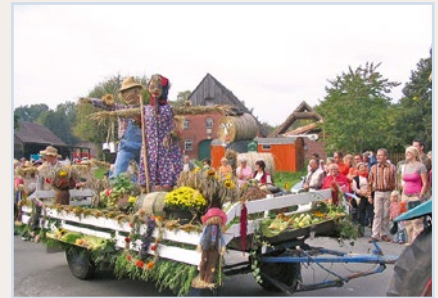
Erntefest-Umzug in Kassebruch