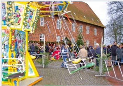
Christkindl-Markt, Burghof Hagen