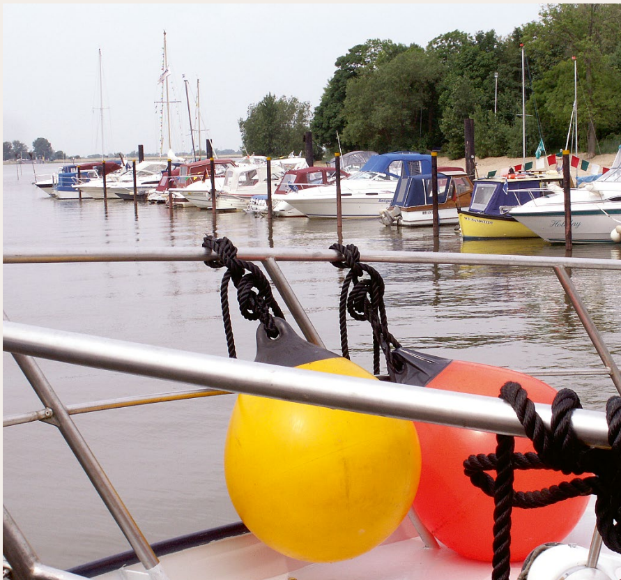
Der Sportboothafen in Sandstedt.