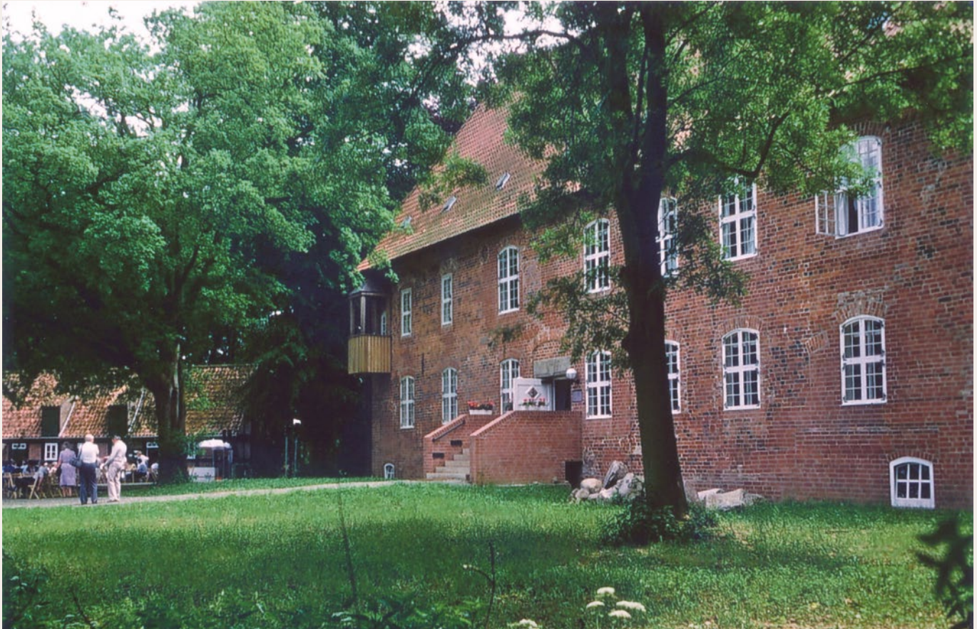
Die frühere Sommerresidenz der Bremer Bischöfe »Die Hager Burg« ist Zentrum von kulturellem Leben