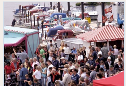
Hafenfest in Sandstedt