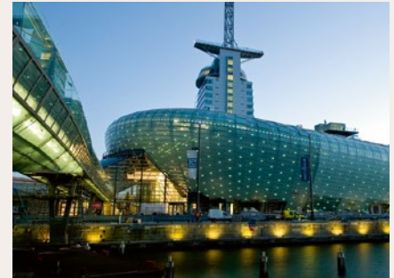
Klimahaus®Bremerhaven 8° Ost-Nachtsansicht

Bremerhaven – mit dem HafenBus durchs Hafengelände hinter die Kulissen schauen, Zoo am Meer, Erlebnismuseen wie das Auswandererhaus oder das Klimahaus, Fischereihafen mit entsprechender Gastronomie u.v.m.