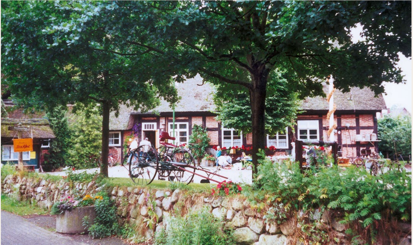
Das Niedersachsenhaus in Bramstedt – eine Hofanlage mit Backhaus, Schafstall und Wagenremise